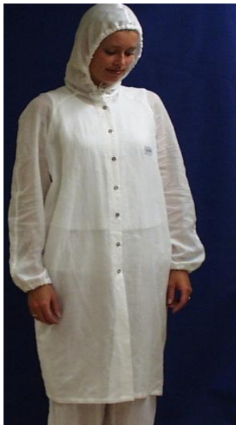
Mod.241 med kapschong, raglanärm

Långsskjorta med raglanärm och med krage eller kapschong . Mod 240 eller Mod.241