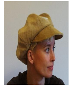
Kläderna sys av avskärmningstyger i Swiss Shield