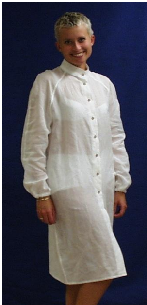
Mod. 240 med krage, raglanärm

Resår runt vristen. Rita av foten vid beställning. Tyg Wear, Naturell eller Evolution.